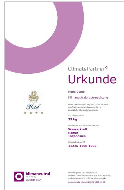
Beispielurkunde für eine klimaneutrale Übernachtung